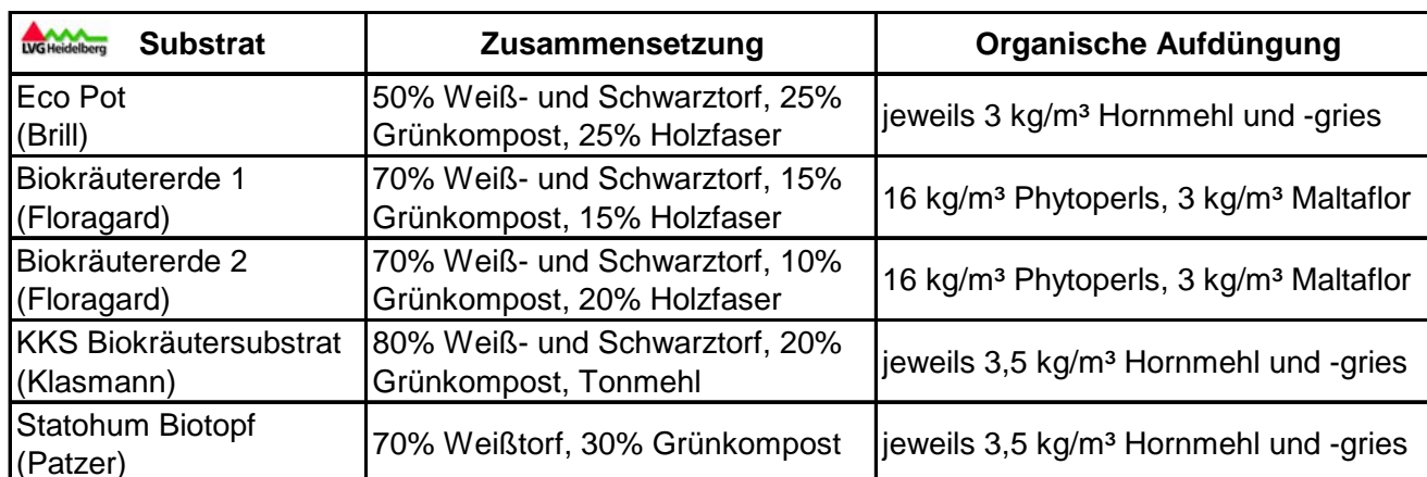
Tab. 1: Biokräutersubstrate im Versuch

Von Seiten der Kräuterproduzenten im Bioanbau wird oft gefordert, dass die notwendigen Nährstoffe in Form von organischen Depotdüngern ins Substrat eingemischt werden. Somit ist während der Kultur keine flüssige Nachdüngung mehr erforderlich. In einem Praxisversuch mit Topfbasilikum, Borretsch und Petersilie wurden fünf handelsübliche Biokräutersubstrate von verschiedenen Herstellern verwendet, die sich in ihrer Zusammensetzung sowie in der Art und Menge der organischen Aufdüngung unterschieden.